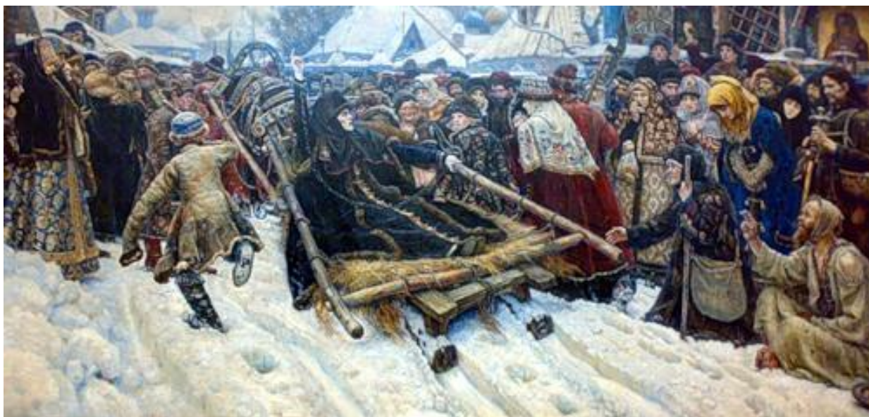
В. Суриков «Боярыня Морозова»

Проанализировать произведение по следующим параметрам: